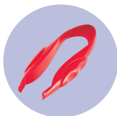
Tweezer (untuk mengambil sampah)