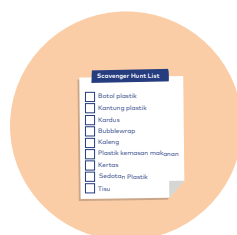
Scavenger Hunt List

Ajak anak berkeliling di sekitar area rumah dan temukan benda-benda di bawah Lalu ceklis di kotak yang sudah disediakan!